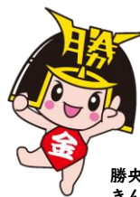
勝央町マスコットキャラクター きんとくん